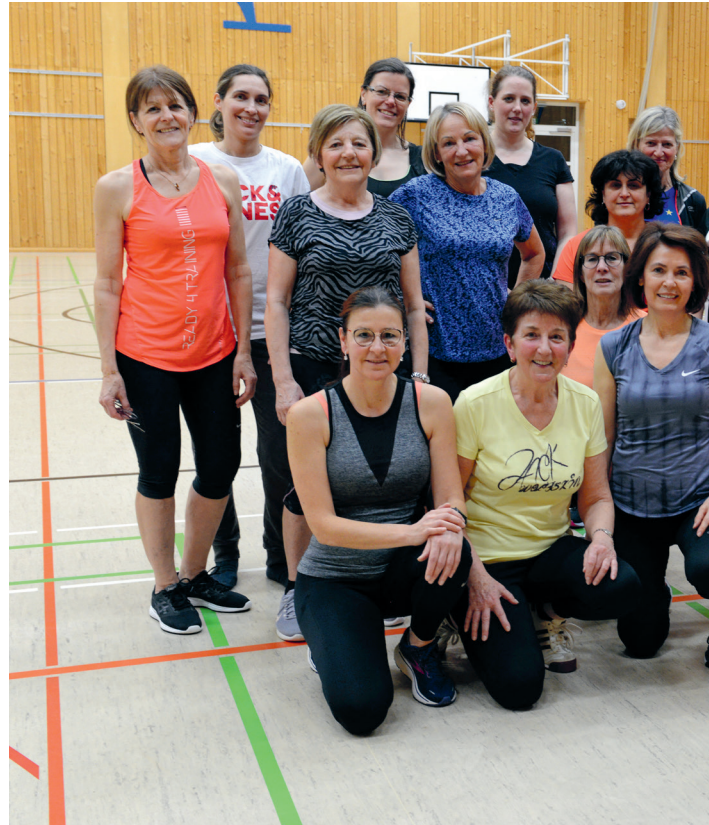
Freude an gemeinsamer Bewegung verbindet die zahlreichen Mitglieder des DTV